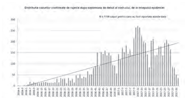
Fig. 2. Distributia cazurilor de rujeola confirmate dupa saptamana de debut al rash-ului - Romania, 2016-2017

Från rumänska institutet för folkhälsa, daterad 1 september 2017.