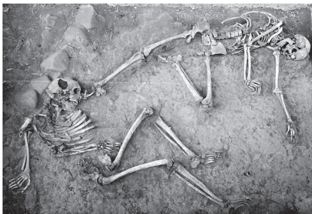
Hunden Fabel markerar skelett med magen.

lena varit med så många gånger att också hon kan se när Fabel tjuvmarkerar.