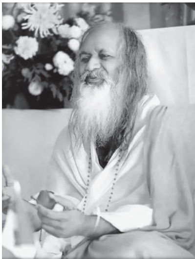
Maharishi Mahesh Yogi