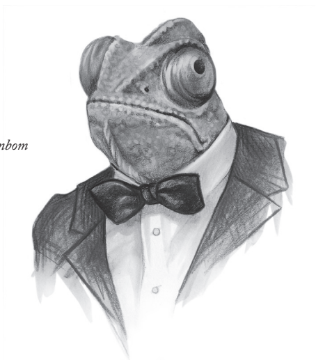
Illustration: Maria Björnbom Öberg.

ter dygnet runt. Kanalen ska heta TPV, The People's Voice , och reklam för kanalen berättar att man ska ta upp nyheter och vinklingar som ignoreras av vanliga massmedia: "Vi vill att reportrar på presskonferenser ska ställa de frågor som vanliga massmedia inte skulle drömma om att ställa – som de faktiskt skulle bli skräckslagna av att ställa."