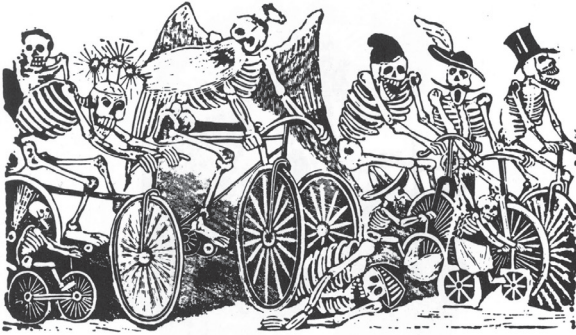
Posttraumatiskt stressyndrom?