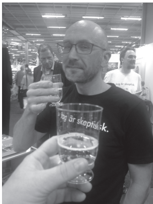
Mys i montern

dag. Besökarna bjöds på placebo för homeopatisk sömnmedicin i form av Skittles medan de fyllde i årets nyhet – en quiz med frågor relaterade till vetenskap och dagsaktuella händelser innehållande ett par riktigt luriga frågor och en och annan slamkrypare därtill. Trots enstaka muttanden om att det var för svårt så verkade de flesta