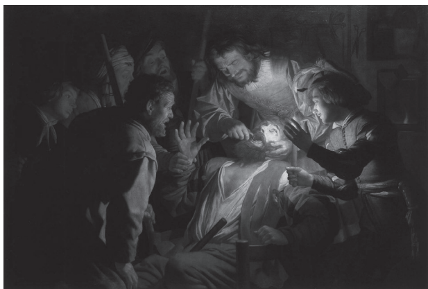
Tandvärkens konsekvenser, Gerhard van Honthorst 1622

ryckningar och värk. Enligt förbundet är det dessutom inte bara amalgampomber med kvicksilver, utan även silver, guld, titan och plast som kan orsaka besvär. Förbundet menar att 400 000 personer kan vara drabbade bara i Sverige.