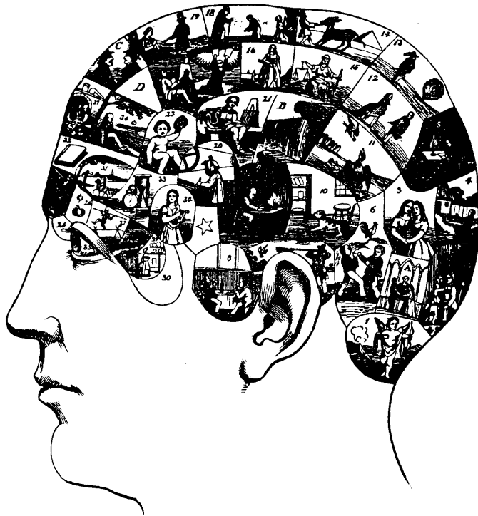
frenologi. Ur Svenska Familj-Journalen (1864): "bild, föreställande ett människohufvud indeladt i flere afdelningar, motsvarande läget av de organer eller hjerndelar, hvars yttringar betecknas af de små figurernas sysselsättningar och betydelse." Avdelningen längst ned i nacken visar centrum för könsdriften.

se" ändock påstår att de kan bedöma en människas viktigaste karaktärsdrag.