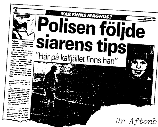
Ur Aftonbladet 25 augusti 1986

- Alla tips som gett oss några uppgifter att leta efter är kontrollerade, sade polisinspek-